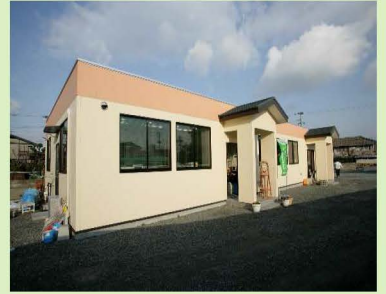
↑事務所全景(高砂町)